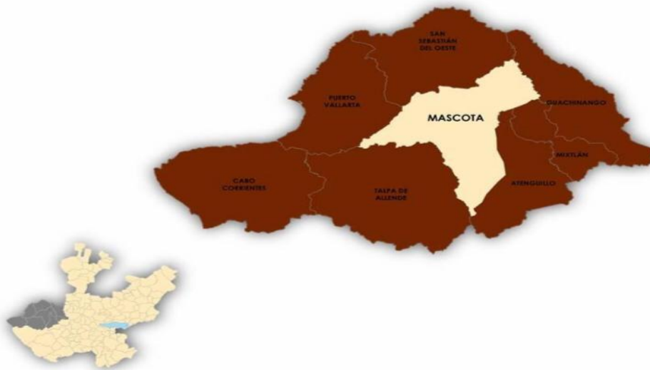
Figura 1. Mascota, Jalisco. Localización geográfica.